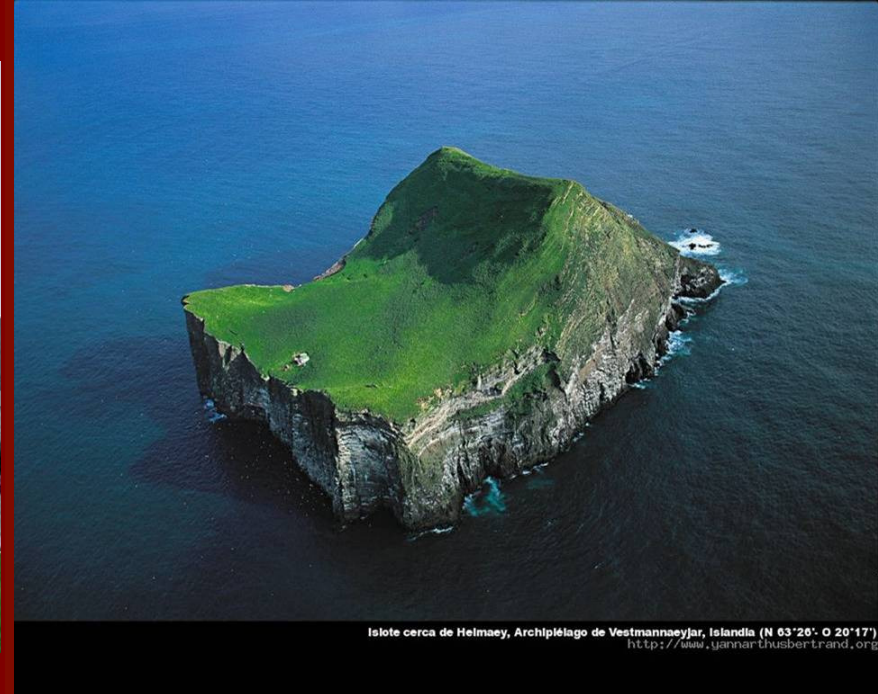
Islote cerca de Helmaey, Archipiélago de Vestmannaeyjar, Islandia (N 63°26' O 20°17') http://www.jannar-thusbertrand.org