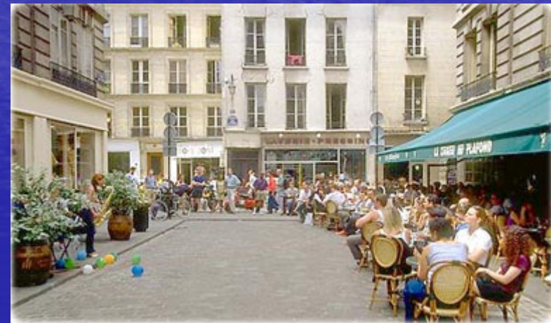
Outdoor Café em Paris