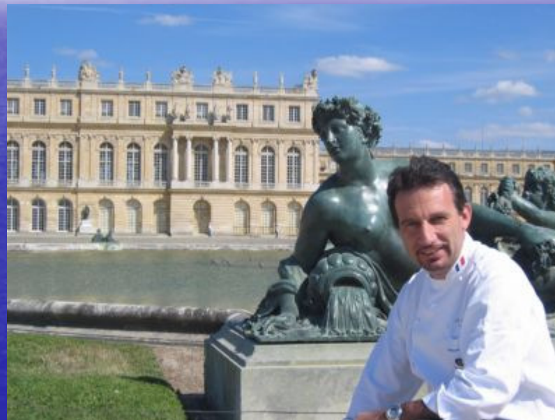
Presidente de frente ao Palácio