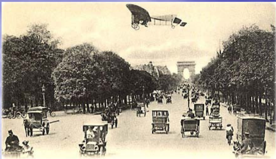
Avenida Champs Élysées, no início do século 20