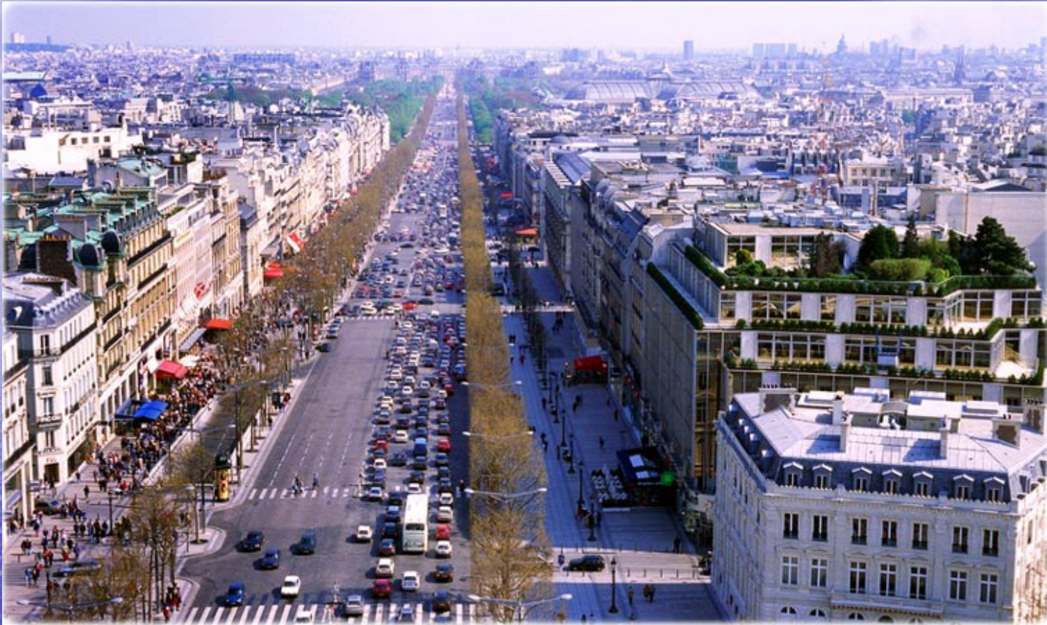
A moderna Avenida Champs Élysées vista do Arco do Triunfo