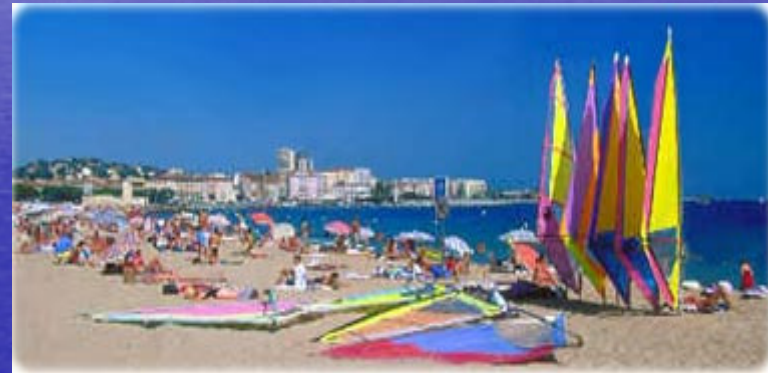
Praia em Saint-Raphaël, Côte d'Azur, costa do Mediterrâneo.