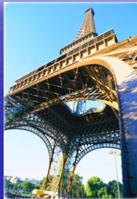
A Torre Eiffel, em Paris. Vista da parte de baixo