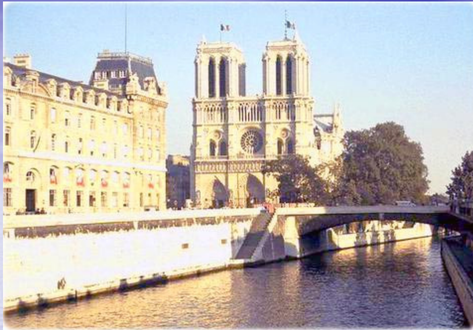
Catedral de Notre Dame e o Rio Sena, em Paris