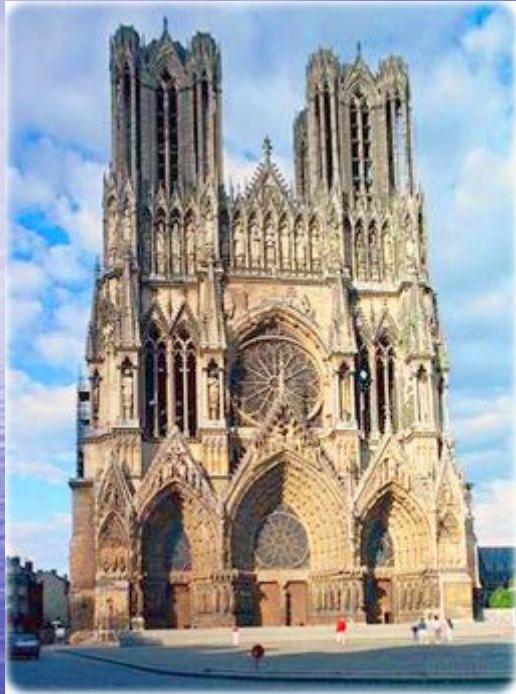
Notre Dame de Reims, construção iniciada em 1211. Reims foi o local da coroação de vários reis da França.