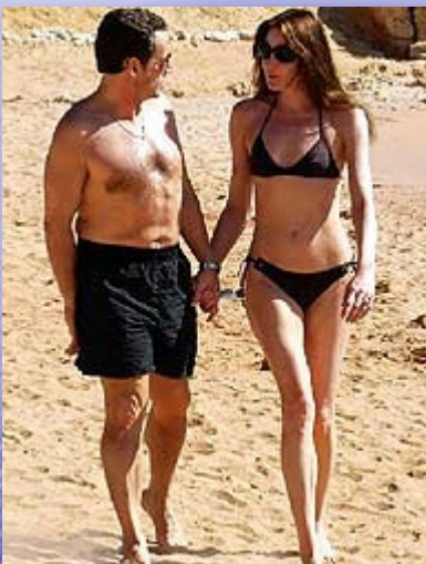
Nicolas Sarkozy e Carla Bruni: presidente francês e ex- modelo teriam se casado no Palácio do Eliseu